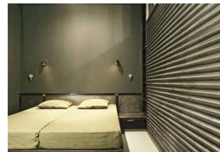
Il costo per i lavori interni di ristrutturazione è stato di € 1.200/mq per un totale di € 103.200 su un'area di 86 mq.

zi interni è concepito attraverso moduli. L'altezza massima è di 2,80 m e le partizioni interne verticali in metallo e vetro sono formate da moduli quadrati di 0,7x0,7 m (4 moduli da terra a soffitto). Le porte sono tutte alte 2,1 m (0,7 m per 3 moduli) come il piano ammezzato, l'unità mobile in salotto è pari a 2 moduli, infine i piani degli scaffali arrivano fino al soffitto intervallati da un'altezza di