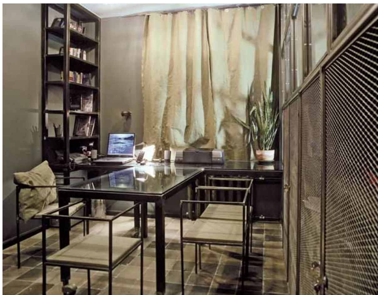
Nello studio un tavolo in vetro con la struttura in ferro e sedie con struttura in ferro. Lo scaffale e i ripiani seguono l'andamento modulare. Pavimento in piastrelle che variano dalle tonalità del grigio a quelle color tortora. Sotto, vista del soggiorno: sullo sfondo l'unità mobile in salotto e un altro scorcio dello studio con un divano letto.